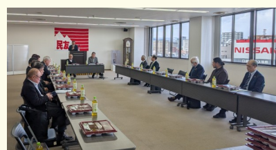
福島民友新聞社での移動例会